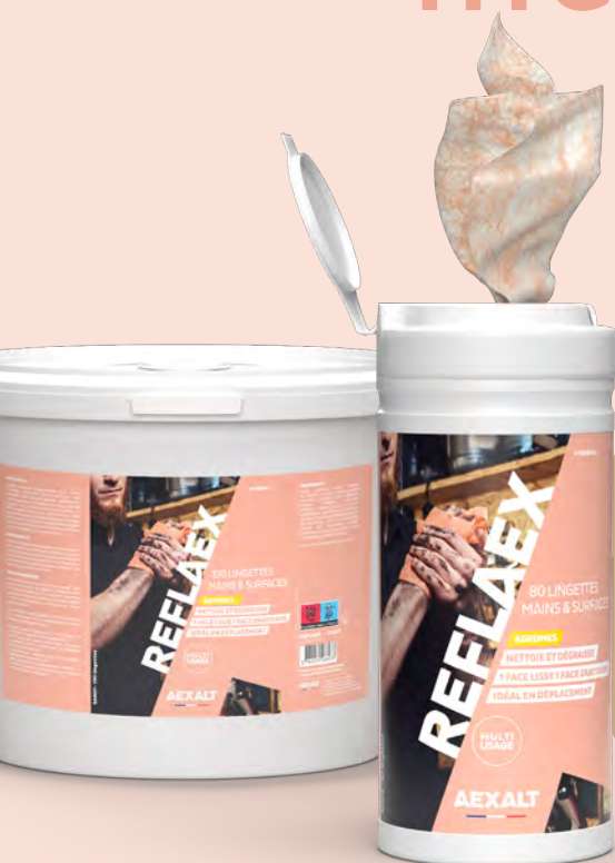
SA606 - 80 LINGETTES SA607 - 130 LINGETTES