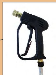
POIGNEE DE PULVERISATION 280 bar – 25 L/min – 150°C