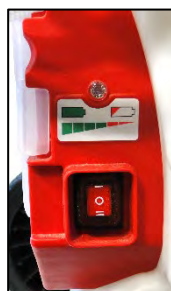
TEMOIN DE CHARGE

2. Introduire la batterie dans son logement (situé sur la face arrière du pulvérisateur).