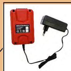
CHARGEUR + BATTERIE Secteur 230V