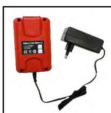
CHARGEUR + BATTERIE

1. Charger la batterie 2 heures minimum à l'aide de son chargeur sur secteur 220 V.