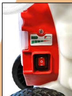
INTERRUPTEUR 3 POSITIONS 1 – Grande débit 0 – Stop 2 – Petit débit Avec témoin lumineux de charge batterie