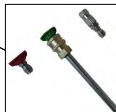
BUSES DE PULVERISATION Montage par coupleur rapide