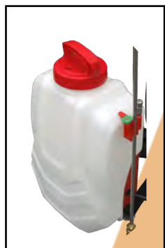
RESERVOIR Capacité de 15 litres Matière : PE