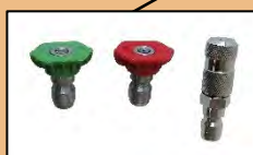
BUSES DE PULVERISATION 1 buse à jet plat (verte) 1 buse à jet droit (rouge) 1 buse à jet brouillard (blanche)