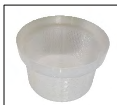
TAMIS FILTRANT Amovible et facile à nettoyer