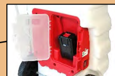
EMPLACEMENT BATTERIE Coffret avec porte protégeant des chocs et des éclaboussures