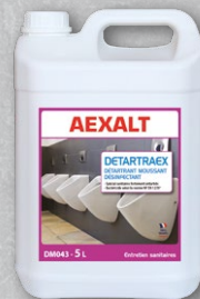
DM043 - Bidon 5 litres