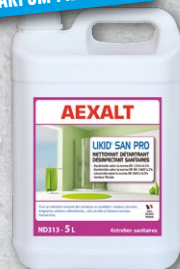
ND313 - Bidon 5 litres