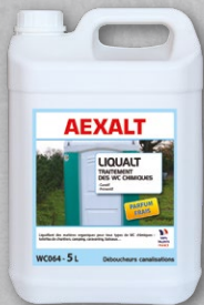
WC063 - Bidon 1 litre WC064 - Bidon 5 litres