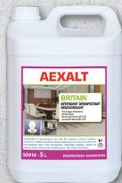
S0016 - Bidon 5 litres