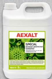
ND310 - Bidon 5 litres

Locaux communs, milieux sales et malodorants (remises, caves, locaux techniques, containers, arrières cuisines...).