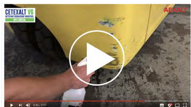
CETEXALT VG - Dégraissant industriel polyvalent concentré 99% végétal

Notre environnement c'est vous ! Visionnez la vidéo de présentation : www.youtube.com/watch?v=fbpxUvFRx6k